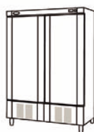
ASN 800 II