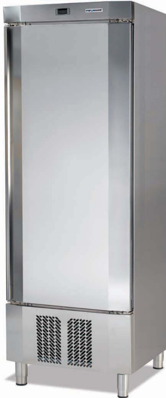
ASN 400 II