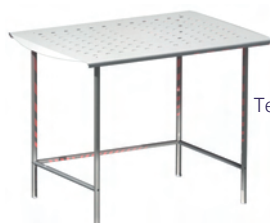
Tejado para B2/5 GRE.B5.D10