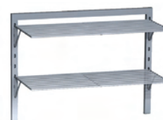
Pack de soporte F2 GRE.F2.P72