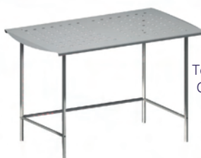
Tejado para B2/6 GRE.B6.D10