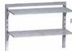
Pack de soporte F2 GRE.F2.P72