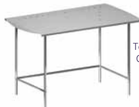
Tejado para B2/6 GRE.B6.D10