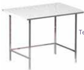
Tejado para B2/5 GRE.B5.D10