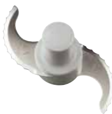
cuchilla serrada Opcional