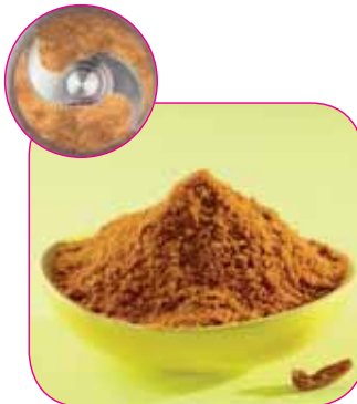
Picados de especias