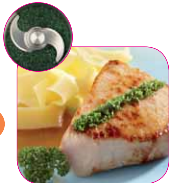
Picados de hierbas