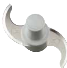
cuchilla dentada Opcional