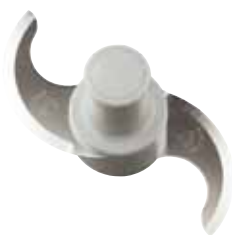
cuchilla lisa Estándar