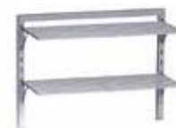
Pack de soporte H8 GRE.H8.P72